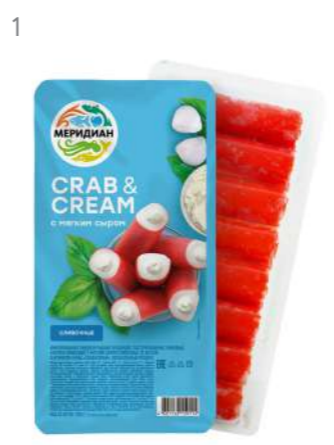
Крабовые палочки с мягким сыром Crab&Cream